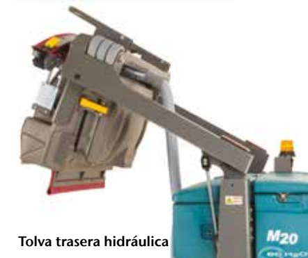
Tolva trasera hidráulica