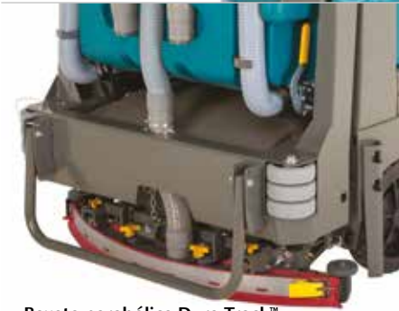
Bayeta parabólica Dura-Track™