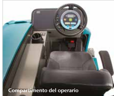
Compartimento del operario