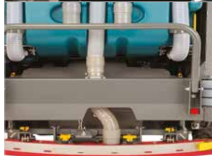
Puntos de contacto amarillos para el mantenimiento

Tejadillo de protección que previene que el operario sea golpeado por objetos que salgan despedidos.