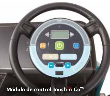
Módulo de control Touch-n-Go™